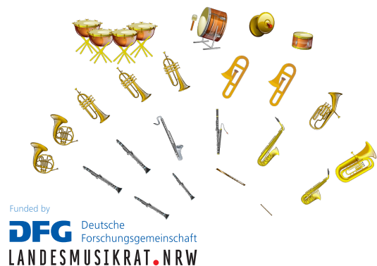
Abbildung 5: Beispielhafte Orchesterbesetzung und Sitzordnung für Holsts First Suite mit 19 Blasinstrumenten und Schlagwerk. Die Darstellung illustriert die instrumentale Vielfalt und räumliche Anordnung als Grundlage komplexer Ensembleszenarien.

Aufbauend auf diesen kontrollierten Szenarien wird der Ansatz im nächsten Schritt auf komplexere Ensemblesituationen erweitert. Hierzu werden die First Suite (1909) und